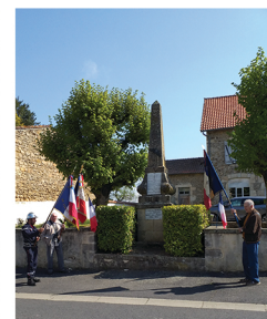
Cérémonies du 8 mai