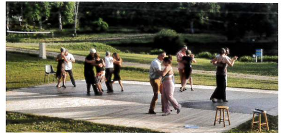
Tango, 17 juin