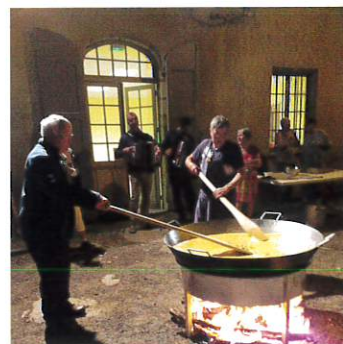
Omelette géante, 10 septembre

Le concert inaugural avec Edwin Crossley Mercer et d'autres musiciens a enchanté le public de 130 personnes.