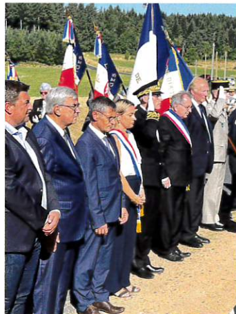
Commémoration bataille de Chaméane, 31 juillet

Nous comptons sur votre coopération pendant cette période de préparation. Si vous avez des questions ou des suggestions contactez la mairie ou un de vos conseillers.