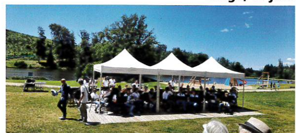
Concert des jeunes italiens, 5 juillet