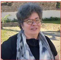
Elisabeth Chatenet Bibliothèque, archives Les Noalhats