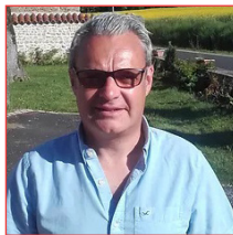
Pierre Jouve Immobilier, communication Escout