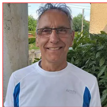
Alain Pinot Animations, vie associative, tourisme Bellevue