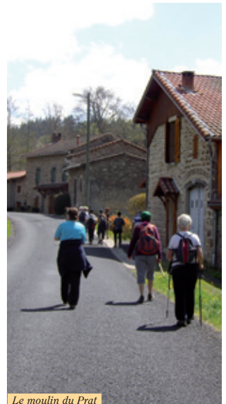
Le moulin du Prat

4 Juste avant l'entrée du village de la Chotte monter un chemin à gauche dans les bois. Au carrefour, continuer à monter en face. Au carrefour de 4 chemins, continuer tout droit jusqu'au village de la Faye (vue sur le Massif du Sancy, la Chaîne des Puys et le Plomb du Cantal). Suivre la route en face et à la sortie du village, tourner sur le chemin de gauche. Continuer jusqu'au Vernet-la-Varenne, emprunter la route à gauche derrière l'église puis à droite après la fontaine pour retrouver le départ du circuit.