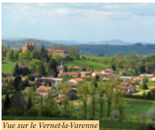
Vue sur le Vernet-la-Varenne

2 Dans le virage, quitter la route et monter un chemin en face. Au croisement, continuer tout droit et 30m plus loin, monter le sentier à gauche. Continuer toujours tout droit à la prochaine intersection jusqu'au bâtiment agricole. Garder le chemin qui part en face longeant un pré, rentrer dans le bois. Continuer en face aux intersections suivantes jusqu'à sortir du bois et arriver aux carrefours de 4 chemins.