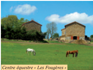
Centre équestre « Les Fougères »

D Depuis la place du Vernet-la-Varenne, emprunter la rue montante à gauche du panneau de départ. Devant l'église, tourner à gauche (vue sur le château de Montfort) et continuer en face sur la D75. Devant le cimetière, descendre un chemin à gauche. Au croisement de 3 chemins, continuer en face. Rejoindre la route goudronnée dans le village de Fougères. La suivre à gauche sur 50m.