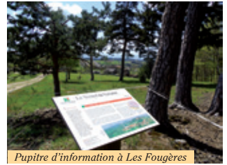
Pupitre d'information à Les Fougères

3 Emprunter le chemin descendant à droite vers le village de Frideviale. Dans ce village, tourner à droite. La route goudronnée devient chemin. Laisser un chemin à gauche et continuer jusqu'à la route à l'entrée des Violettes. La suivre à droite pour traverser ce village. A la sortie de celui-ci, prendre le chemin le plus à gauche. Ignorer le chemin carrossable à gauche.